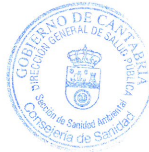
Virginia Ruiz Camino DIRECTORA GENERAL DE SALUD PÚBLICA